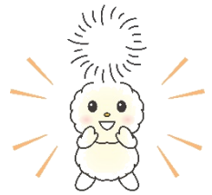
朝霞市キャラクター「ぼ」