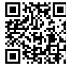
連絡メール2 保護者登録