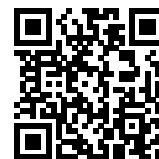
連絡メール2 保護者ログイン

* 保護者サイト https://renraku.education.ne.jp/parent/