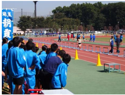
【朝霞地区駅伝競走大会】