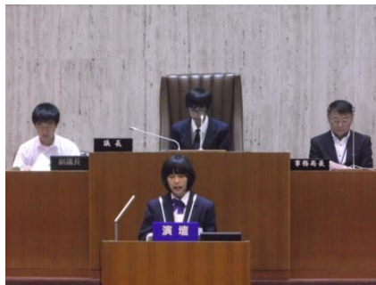
【朝霞“未来・夢”子ども議会】