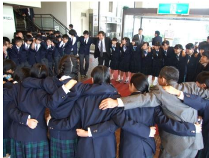
【合唱コンクール本番を前に】