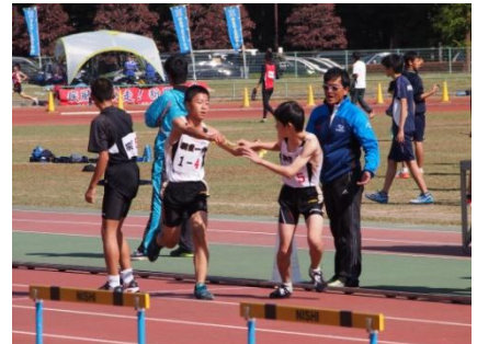
【駅伝大会での力走】