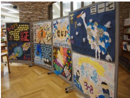
【思いを込めた合唱曲紹介パネル】