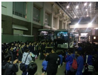
【吹奏楽部帰校の様子】