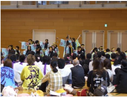
【ふれあいフェスティバルの様子】