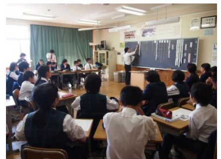
【道徳の研究授業の様子】