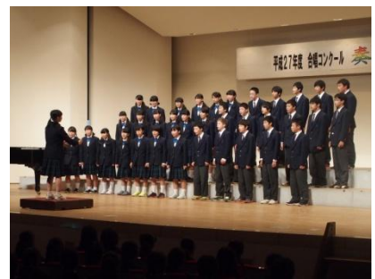
【市民会館大ホールでのクラス合唱】