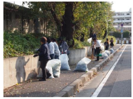
【PTA花植え・除草活動】