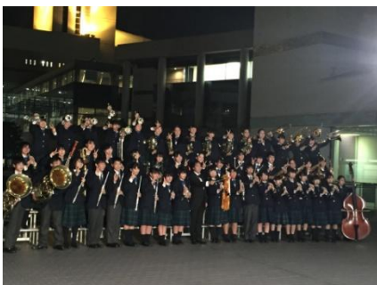
【全日本吹奏楽コンクール金賞受賞】