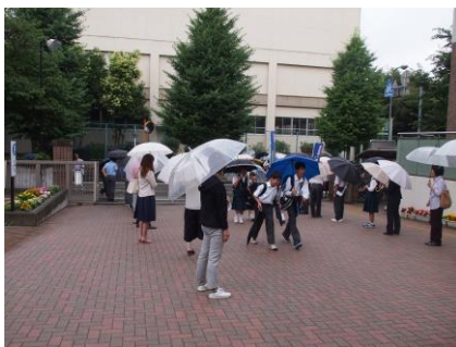
【小・中・高が連携したあいさつ運動】