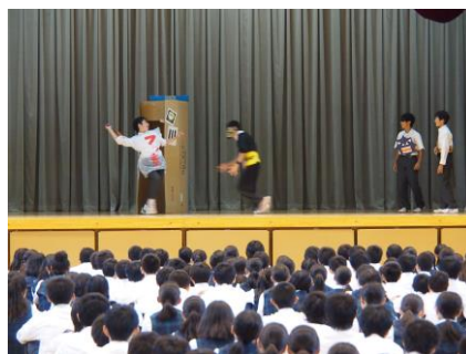
【歯の健康を啓発する寸劇】