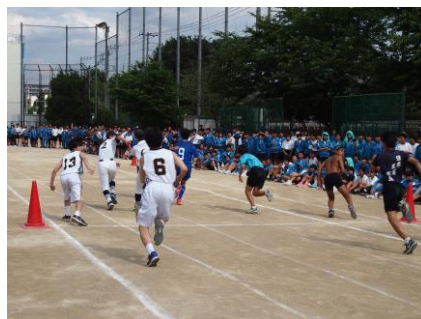
【体育祭で延期していた部活リレー】