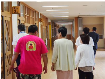
【学校評議員会の授業視察】