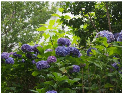
【屋上庭園を彩るあじさいの花】