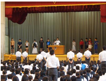
【壮行会で抱負を語る各部長】