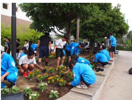
【美化委員による花壇の整備】