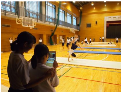
【授業でのタブレット活用】