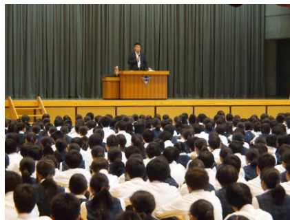
【朝会での校長講話】