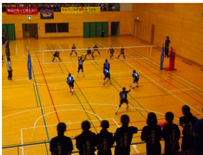
【健闘した学校総合体育大会】