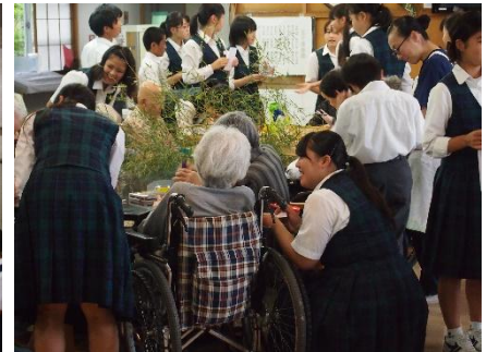
【福祉施設訪問活動(朝光苑)】

今日で1学期が終わりました。4月8日の始業式・入学式から3カ月余り、生徒たちは行事や日々の学校生活に全力で取り組み大きく成長しました。明日から始まる42日間の夏休み、部活動に汗を流す人、受験勉強に必死で取り組む人、休みにしか経験できないような貴重な体験をする人、家族で楽しく触れ合う人・様々なことがあると思います。いろいろな経験を経て一段と成長する42日間であるように願っています。