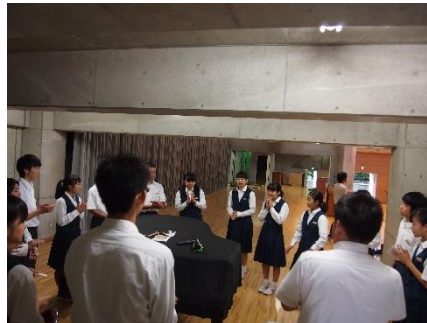
【生徒朝会后行っている反省会】