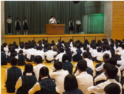
【委員長からの活動報告】