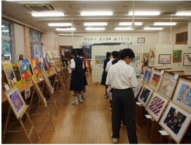
【文化部発表会(美術部)】