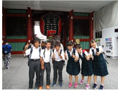
【東京フィールドワーク(雷門)】