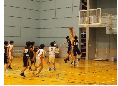
【新人体育大会(男子バスケ部)】

夏休み明けの1か月は、本当にあわただしく過ぎていきました。文化部発表会、3年生対象の認知症サポーター養成講座、2年生の東京フィールドワーク、生徒会選挙と行事やイベントが目白押しで、月末から今週にかけては運動部の新人戦地区大会も始まりました。