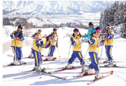
【2年スキー林間学校】