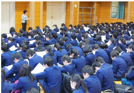
【3年県公立高校受検事前指導】