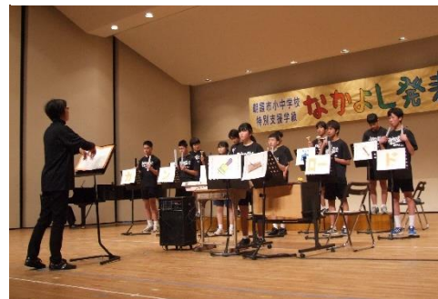
【8・9組なかよし発表会】

3月に入り、少しずつ春の気配が感じられるようになりました。3年生は先週末に県公立高等学校の入試も無事終了し、それぞれの進路を確定することになります。長かった中学校生活もあと10日ほどで終わり、卒業式を迎えます。1・2年生は2月にそれぞれ社会体験チャレンジとスキー林間という大きな行事を経験し、一回り大きく成長しました。この経験は次への大きなステップとなったと思います。