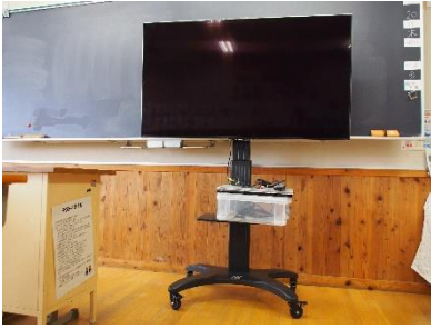
【PTA から寄贈いただいた大型テレビ】