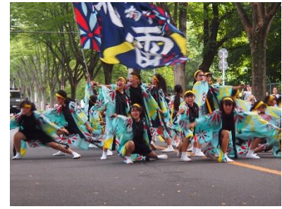
【朝霞一中鳴子隊風雷の演舞】

今年の夏休みは、40年ぶりに21日連続で降雨を記録するなど、8月にしては涼しい日々が続きました。月末になって猛暑が戻ってきましたが、突然のゲリラ豪雨に見舞われるなど異常気象ともいえる状況でした。