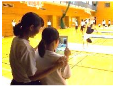
【ICT 機器を活用した授業の様子】