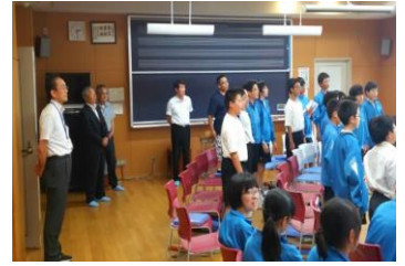
これからお世話になります。 音楽の授業を視察する学校評議員

6月21日、第1回学校評議員会が開催されました。評議会では、携帯やスマートフォンの適切な活用方法や、授業についてなど、本校の現状や課題について評議しました。後半の、校内視察では、各授業を参観していただきました。