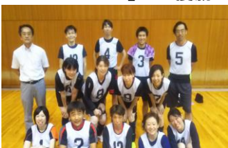
優勝したファーストベアーズ

平成30年9月1日(土)、朝霞市総合体育館にて、PTAバレーボール大会が開催されました。市内各校、強豪がひしめく中、日頃の練習の成果と力強い団結力が実を結び、一中「ファーストベアーズ」が優勝の栄誉を手に入れました。