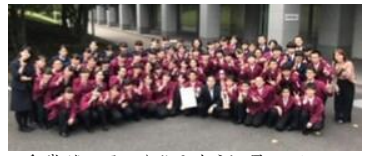
受賞後、互いを称え合う部員の面々

10月20日（土）名古屋市名古屋国際会議場にて、全日本吹奏楽コンクールが開催されました。本校吹奏楽部は、西関東支部代表として参加し、日々の練習の成果が実り、見事金賞の栄光を手にすることができました。部員一人一人の姿は誇らしく、光り輝いていました。