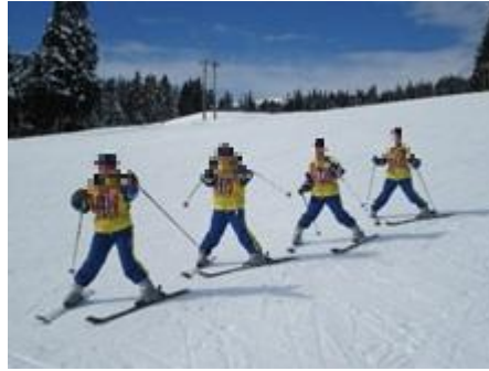
【スキー林間学校(2年)】