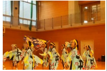
風雷の力溢れる演奏

11月17日（土）本校体育館において開催されたふれあいフェスティバルは、本校吹奏楽部の演奏で幕を開けました。その後、一中鳴子「風雷」の演奏や校区内小学校の発表、高校のギター演奏や鳴子、地域のお囃子や太鼓の演技等相互の交流を通して、ふれあい溢れる一日となりました。