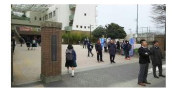
一中校区あいさつ運動 (小・高、学校評議員と連携)