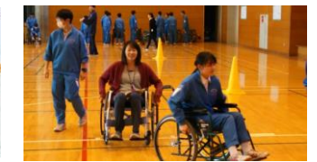
車椅子・アイマスク体験 (市と連携した体験活動)