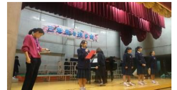
生徒会主催の三年生を送る会(工夫・演出がいっぱい)