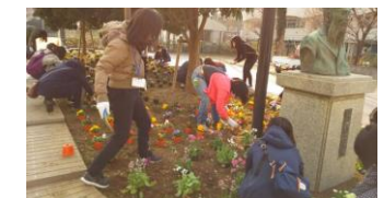
PTA 主催の花植え活動 (明るい花壇になりました)