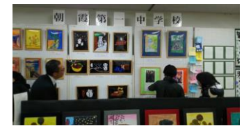
なかよし作品展の開催 (すてきな作品がたくさん!)