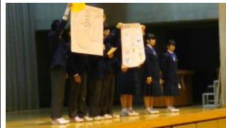
生徒会の啓発活動 (生徒朝会)