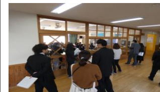
小中連携推進(小学校の先生方が一中に来てくれました)