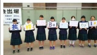
3年生有志によるあいさつ運動 (挨拶はBEAUTIFUL!!)