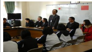
国際交流推進(北京師範大学付属学校の生徒が来校)