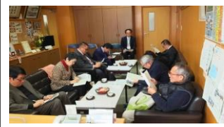
学校評議員会の開催 (学校運営協議会の設置準備)