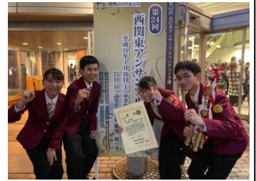
受賞後の四重奏メンバー

1月26日(土)新潟県・新潟テルサにて行われた、西関東アンサンブルコンテストでは、クラリネット四重奏、サクソフォン三重奏ともに金賞を受賞し、クラリネット四重奏は、西関東代表として、3月21日に札幌市で開催される全国大会に出場します。