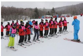
只今スキーの講習中

2月7日(木)からの3日間、スキー林間へ行ってきました。長野県上田市菅平高原スキー場では、好天に恵まれ、楽しいスキー体験、忘れられない学年レク、幻想的だった松明滑走など、全てがかげがえのない経験と思い出になりました。