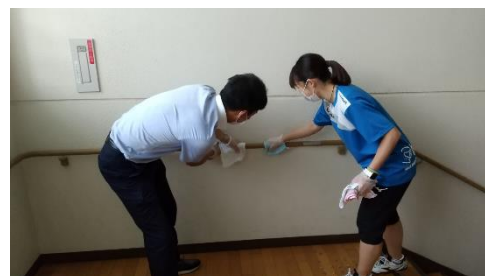
階段手すりの消毒作業