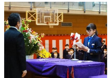
新入生代表の言葉

学校は、分散登校による授業や簡易給食など段階的に教育活動を開始し、少しずつ通常に戻りつつあります。生徒が楽しみにしている部活動は、本日から練習方法を工夫しながら活動を始めました。どの部活動も制限がある中での活動のため、全力で取り組むことができない状況ですが、ほんの少し前進です。