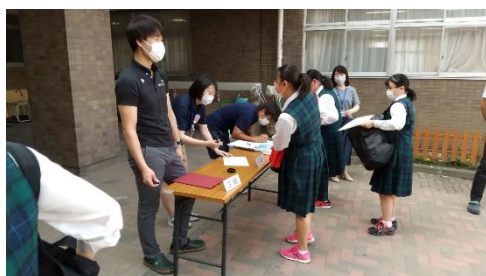
毎朝の健康チェック

また、学校では、 消毒用エタノールによる手指消毒 と こまめな手洗いの励行 に加え、多くの生徒が触れる場所(教室出入口、ドアノブ、スイッチ、水道、トイレ等)を中心に、 毎日、各学年の教員が次亜塩素酸ナトリウムによる消毒作業 を行い、環境衛生管理にも努めています。