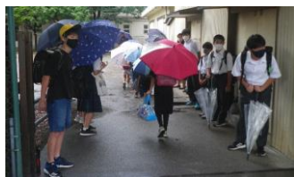
あいさつ運動の様子@一小