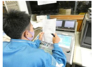
【放送室から全校生徒へ】