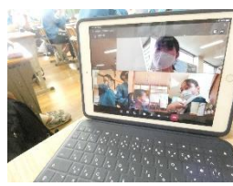
【集計はタブレットで報告】

6月11日(金)、生徒総会が行われました。本年度も新型コロナウイルス対策のため、放送での生徒総会となりました。生徒会スローガン、「Next stage」のもと、生徒会長からは活動方針「一味同心」が伝えられました。各委員会からの活動方針、生徒会、部活動等予算配分や、昨年度の決算報告、本年度の予算案等について、全校生徒で承認しながら、主体的に進行・運営することができました。