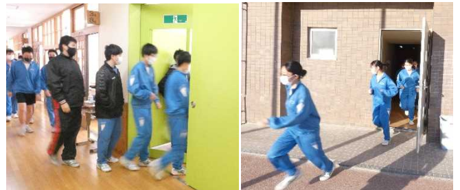
【校舎内は走らない】

1月13日(木)6時間目に避難訓練を実施しました。今回は実際に防火扉が閉まった状態を想定して訓練をしました。また、木曜日の4時間目の授業担当教員が誘導し、体育館や特別教室から校庭に避難するクラスもあり、より効果的な訓練になりました。