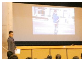
[事故の様子を映像で紹介]

自転車の乗り方を中心に、交通事故に遭わないため、起こさないための注意点を生徒全員に再確認しました。