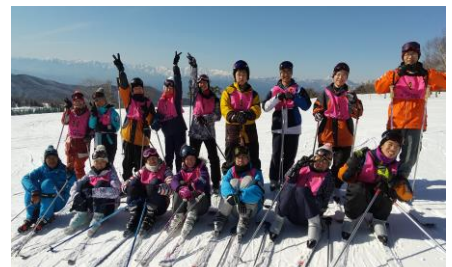
快晴の菅平スキー場（1班）

閉会后、以前からお世話になっている地域の方が近寄って来て、「校長先生、 演奏している生徒を見てると感動して涙が出てきたよ。本当に素晴らしい演奏だった。 」とうれしい言葉をいただきました。