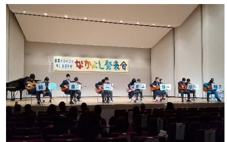
9・10組のギター演奏