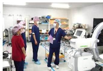
[国立埼玉病院にて]